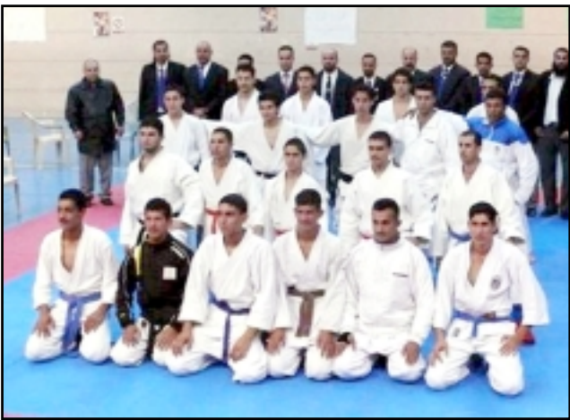
صورة تجمع المشاركين في البطولة.