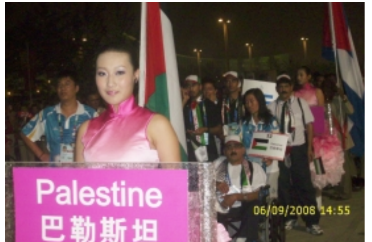
الوفد الفلسطيني خلال افتتاح الالبياد.