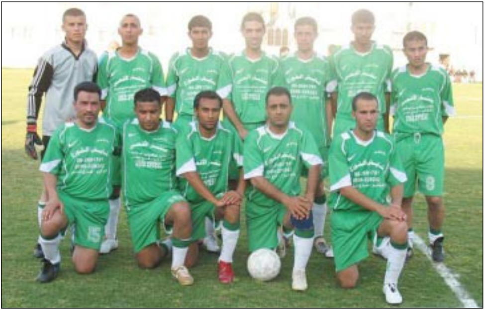
فريق مركز نور شمس.