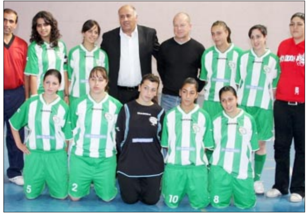
فريق نسوي ثقافي بيت ساحور.