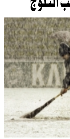
عمال يزيلون الثلوج من أرضية الملعب.