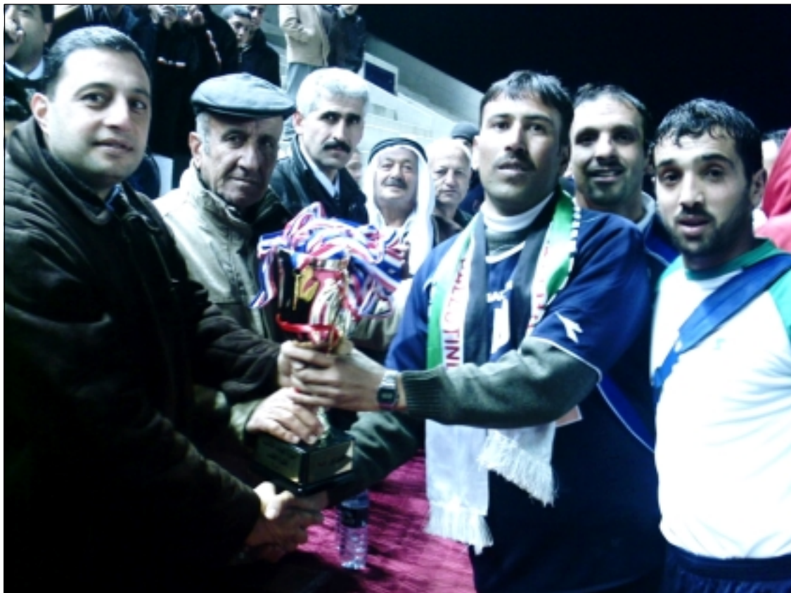
جهد صفر يتسلم كأس أهداف البطولة.